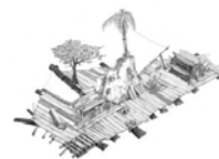
© ALEXIS GAUCHET « dessin du radeau »

À bord de ces radeaux, un équipage d'artistes, d'architectes et de scientifiques. L'expédition s'arrêtera durant le mois de juillet dans différentes communes proches du canal d'Ille-et-Rance pour permettre à chacun d'imaginer cette île. Il fera escale début juillet à St-Germain.